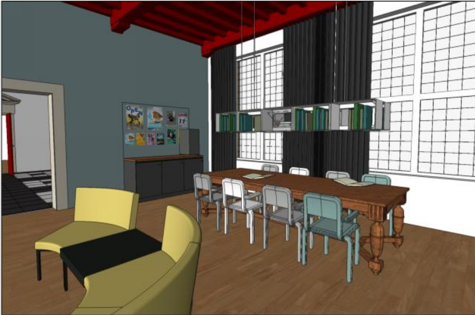
Afbeelding 2 : impressie inrichting Burgemeesterskamer