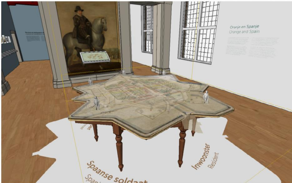
Afbeelding 3 : impressie inrichting Secretarie

Aan de andere zijde van de interactieve wand staat de Zuiderwaterlinie centraal. Het hoofdthema in deze ruimte is Land en Water. Hier gaat het over de band van Nederland met het water en over de rol die water kan spelen bij de verdediging tegen een vijand. Er wordt ingegaan op het ontstaan van de Zuiderwaterlinie, de werking van de linie (inundatie) en de rol van de linie in de geschiedenis.