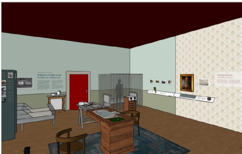
Afbeelding 6 : impressie inrichting Gouverneurskamer

In de verschillende kluisjes in de lockerkast liggen persoonlijke spullen van soldaten, Hier worden een paar authentieke verhalen verteld over soldaten die om en in Willemstad gelegerd waren tijdens de Eerste Wereldoorlog. Wat zijn hun ervaringen? Over wachtlopen, verveling, verlof, verschansingen bouwen, etc.