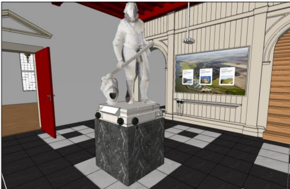
Afbeelding 1 : impressie inrichting hal

De ontmoeting met Prins Maurits en de inwonster van Willemstad vormt de opmaat van ontmoetingen met historische en fictieve personages in de verschillende kamers van het huis. Samen vertellen ze het verhaal van het Mauritshuis, (de Stelling van) Willemstad en de Zuiderwaterlinie. In de tentoonstelling wordt vervolgens waar mogelijk verwezen naar plekken in de omgeving waar de verhalen betrekking op hebben. Zo worden de toeristische informatiefunctie en de museale functie door het hele gebouw geïntegreerd.