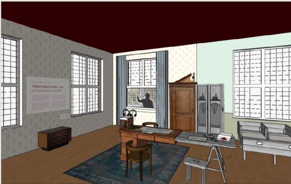
Afbeelding 5 : impressie inrichting Gouverneurskamer

Het andere deel van de ruimte is ingericht als kazerne/militair hospitaal ten tijde van de Eerste Wereldoorlog. Met een ziekenhuisbed, britsen, tafel, lockerkastkast, enz. wordt de juiste sfeer opgeroepen. De bezoeker maakt kennis met een inwonster van Willemstad, die tijdens de Eerste Wereldoorlog soldaten verzorgt in het Mauritshuis. Aan tafel schrijft ze in haar dagboek. In audio hoort de bezoeker haar persoonlijke overpeinzingen en ontboezemingen. Aan de wand foto's van Willemstad tijdens WOI. I