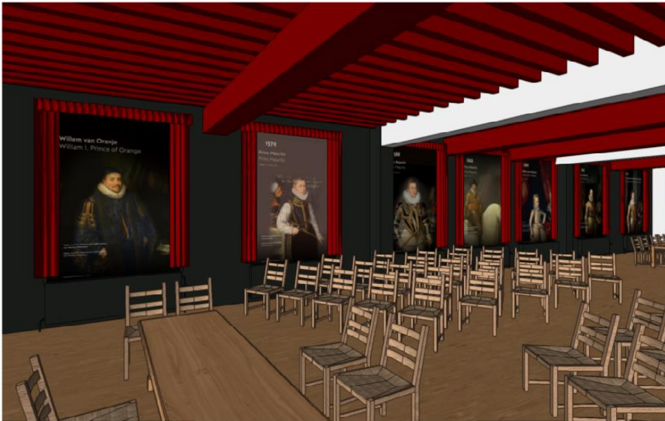
Afbeelding 7 : impressie inrichting Raadzaal

Prins Maurits vertelt de bezoeker in audio over zijn liefdesleven. Hij hoopt nog steeds een vrouw tegen te komen die hem meer voordeel oplevert. De ramen van de raadzaal worden voorzien van rolgordijnen waarop het leven van Maurits in portretvorm is afgebeeld. Wanneer de zaal toegankelijk is voor het publiek hangen de gordijnen naar beneden. Als de zaal in gebruik is als trouw- of vergaderlocatie kunnen de rolgordijnen worden opgehaald.