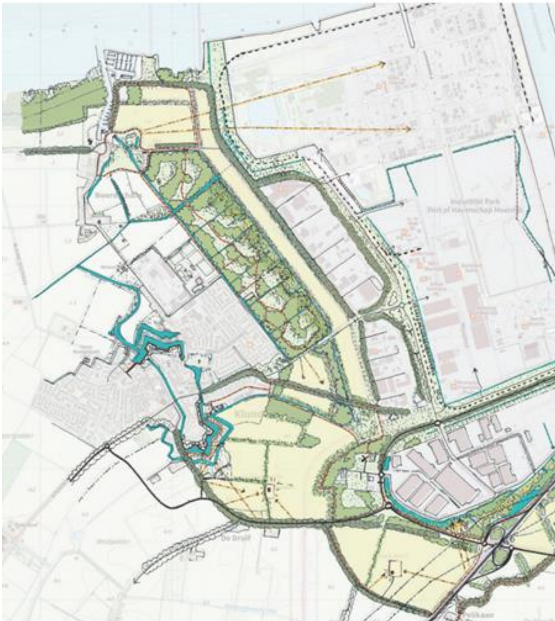
Figuur 1: Uitsnede Ambitievise groenblauwe mantel